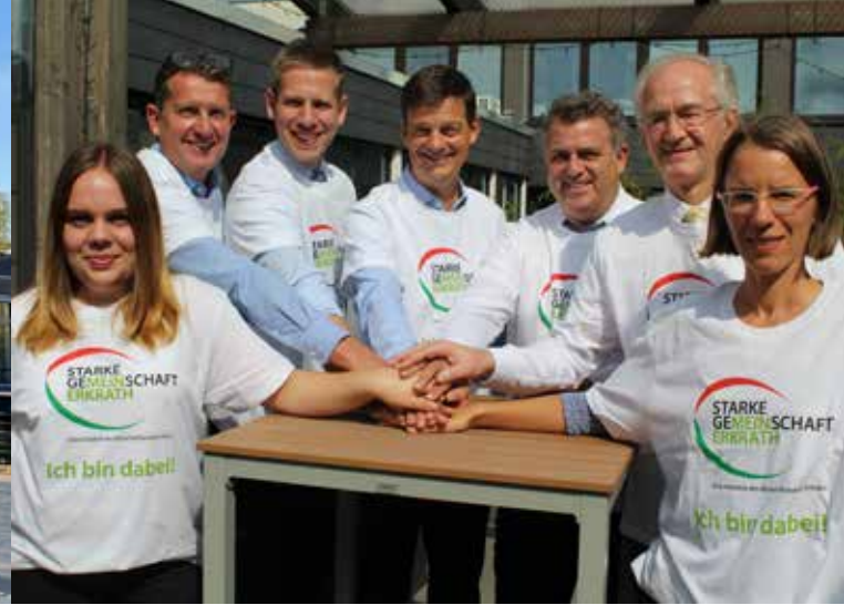
Der Aktionstag – ein Projekt des Wirtschaftskreises Erkrath