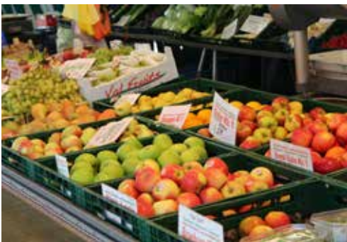
Frisches Angebot auf den Erkrather Wochenmärkten

Kinder und Jugendliche sind die Zukunft – dies wird in Erkrath gelebt. Garantierte Plätze (auch U 3) und gesicherte Ganztagsbetreuung in allen Kindertagesstätten und Grundschulen, inklusive Montessori-Zweig, bieten beste Voraussetzungen für einen guten Start ins Leben. Auch alle weiterführenden Schulformen (Förder-, Haupt- und Realschule, zwei Gymnasien, Internatsschule) sind in Erkrath vorhanden. Vielfältige Vernetzungen zwischen Schule und Wirtschaft, wie beispielsweise das NEAnderLab (Schülerlabor), die Ausbildungsbörse und das Kooperationsnetz Schule-Wirtschaft helfen dabei, den richtigen Weg in den Beruf zu finden.