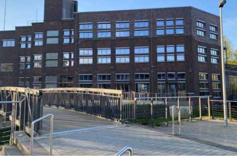
Alte Gießerei- Fassade Haupteingang