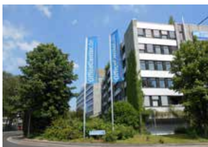
Office Center Erkrath

Darüber hinaus bietet Erkrath in mehreren historischen Objekten eine ganz besondere kreative Arbeitsatmosphäre, wie zum Beispiel in dem ehemaligen Rittergut Haus Morp ( www.hausmorp.de ). Weitere Objekte auf Anfrage.