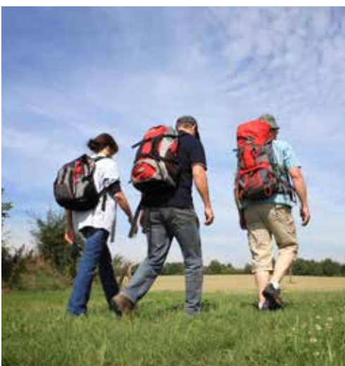
Wandern auf dem neanderland STEIG

210 Einzelhandelsbetriebe im Stadtgebiet auf einer Verkaufsfläche von rund 47.000 m 2 – in jedem der drei Stadtteile gibt es zentral ein umfassendes und attraktives Nahversorgungsangebot, das von weiten Teilen fußläufig erreichbar ist. Kostenfreie Parkplätze stehen ebenfalls ausreichend zur Verfügung, um das Angebot der vielen inhabergeführten Geschäfte zu nutzen. Mit dem öffentlichen Nahverkehr (vier S-Bahnhaltepunkte auf Erkrather Stadtgebiet) sind Königsallee, Altstadt und Rheinpromenade in Düsseldorf sehr schnell erreicht.