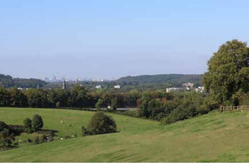
Ausblick auf die Düsseldorfer Skyline